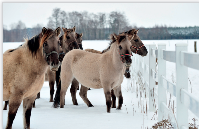
Pietrucha, Ogrodzenie farmerskie dla koni. Jest proste w montażu, nie wymaga malowania a gładka powierzchnia sprawia, że konie nie ocierają się o poprzeczki. Wygląd ogrodzenia pozostaje estetyczny przez lata.