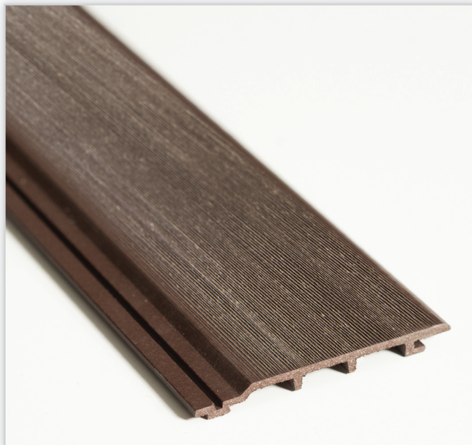
Pietrucha, Panel elewacyjno-sufitowy WPC. Jest ekologicznym, tanim i estetycznym materiałem stosowanym podczas wykańczania elewacji budynków.