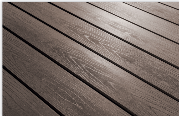
Pietrucha, Deska TerraDeck kompozytowa WPC pełna – polski producent. Bardzo trwała i masywna, nadaje się również do budowy akcesoriów ogrodowych. Na zdjęciu w kolorze brązowym. Index produktu DP-WPC.