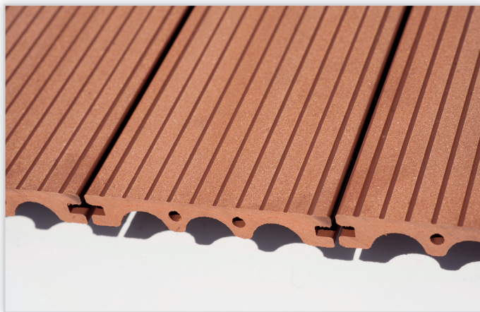
Pietrucha, Deska tarasowa TerraDeck kompozytowa WPC inżynierska – polski producent. Na zdjęciu w kolorze „jasny brąz”. Index produktu DT-WPC.