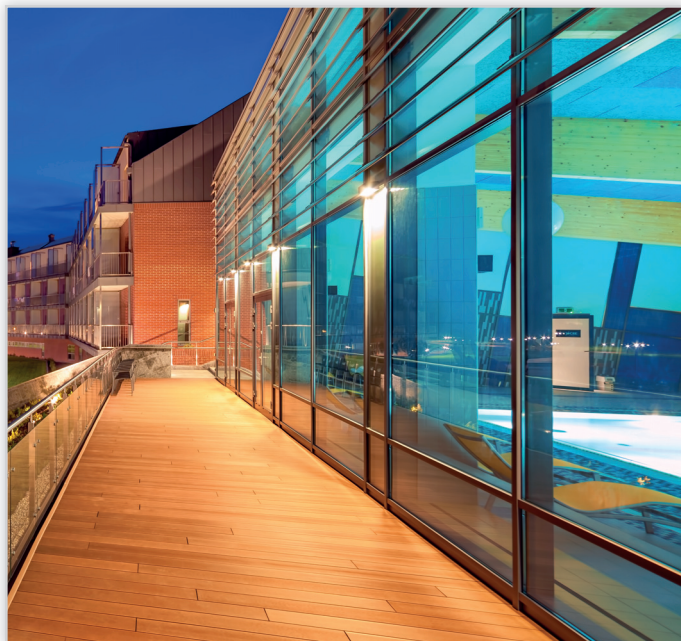
Pietrucha, Deski tarasowe. Realizacja: Hotel Słoneczny Zdrój Medical Spa&Wellness – Busko Zdrój.